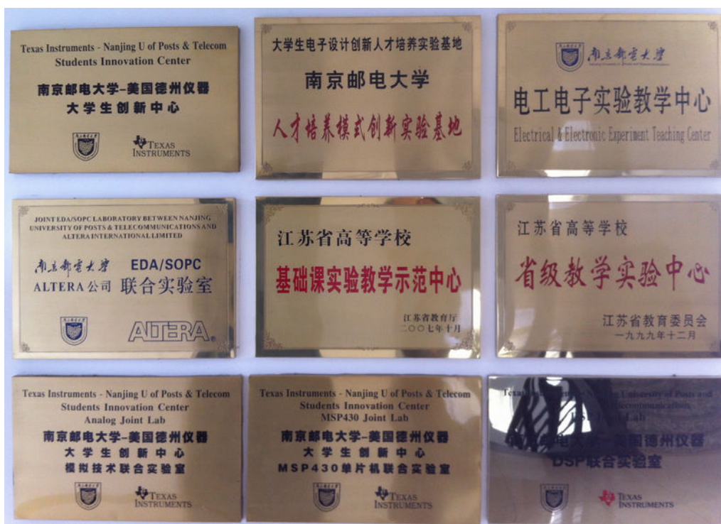
图 2. 中心部分铜牌

本次全国大学生电子设计竞赛江苏赛区测试场所位于南京邮电大学仙林校区教 3 二楼西区电工电子实验教学中心，如上图中红圈位置所示。