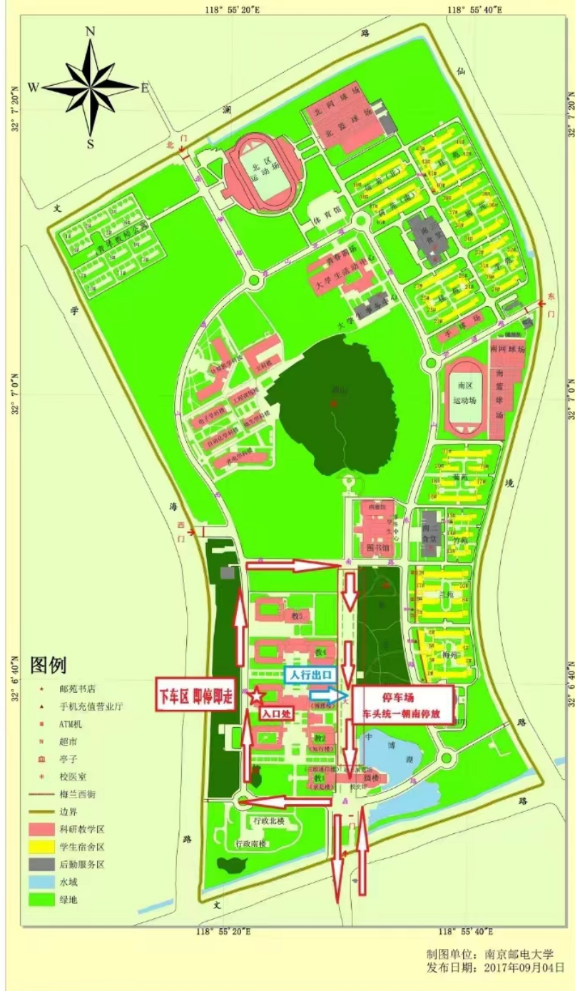
图 4. 送作品车辆及人员路线图