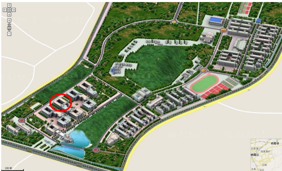
图 1. 中心在校内所在位置示意图

本次全国大学生电子设计竞赛江苏赛区测试场所位于南京邮电大学仙林校区教 3 二楼西区电工电子实验教学中心，如上图中红圈位置所示。