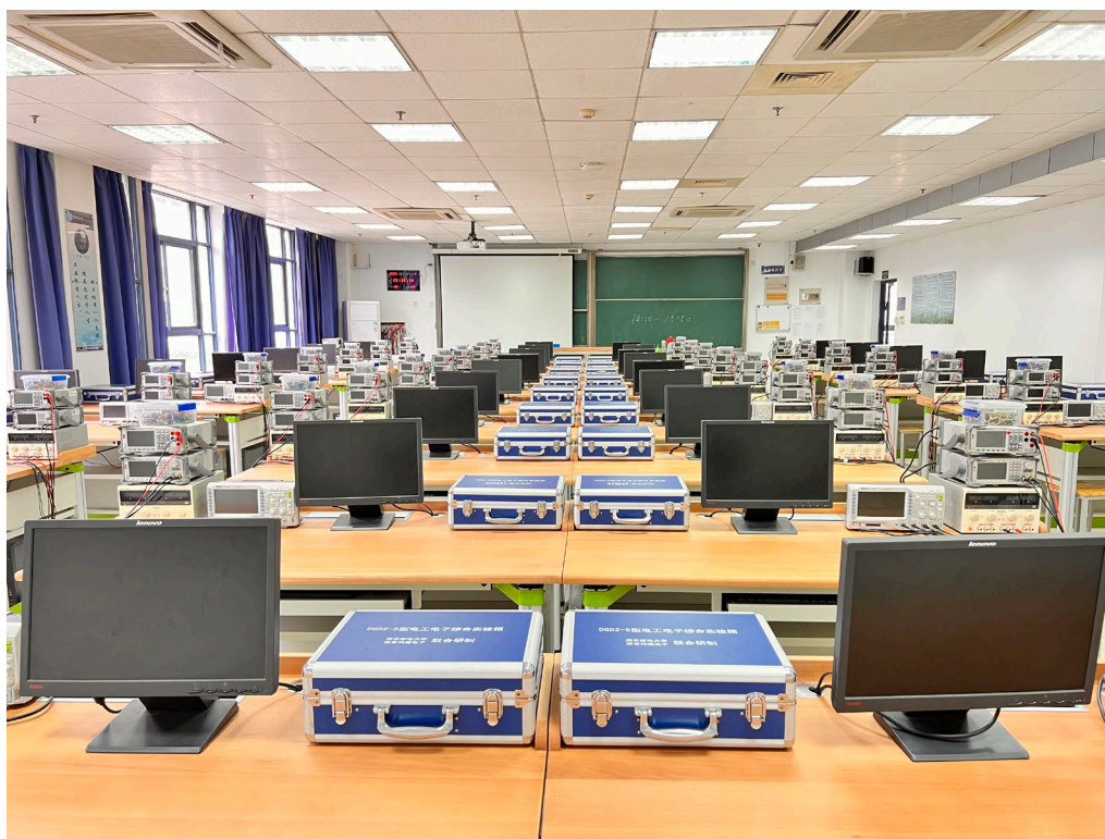
图 3. 测评场地内景

南京邮电大学电工电子省级实验教学示范中心位于我校仙林校区第 3 教学楼 1-4 层，共有各类实验室 20 间，占地面积 2847 平方米。其中包含电工电子实验室 9 间、通信电子电路实验室 2 间、企业联合实验室 4 间、EDA 实验室 1 间、电子技术综合实验室 1 间、南邮-ALTERA SoPC 联合实验室 1 间、创新中心 1 间、表面贴装实验室 1 间。